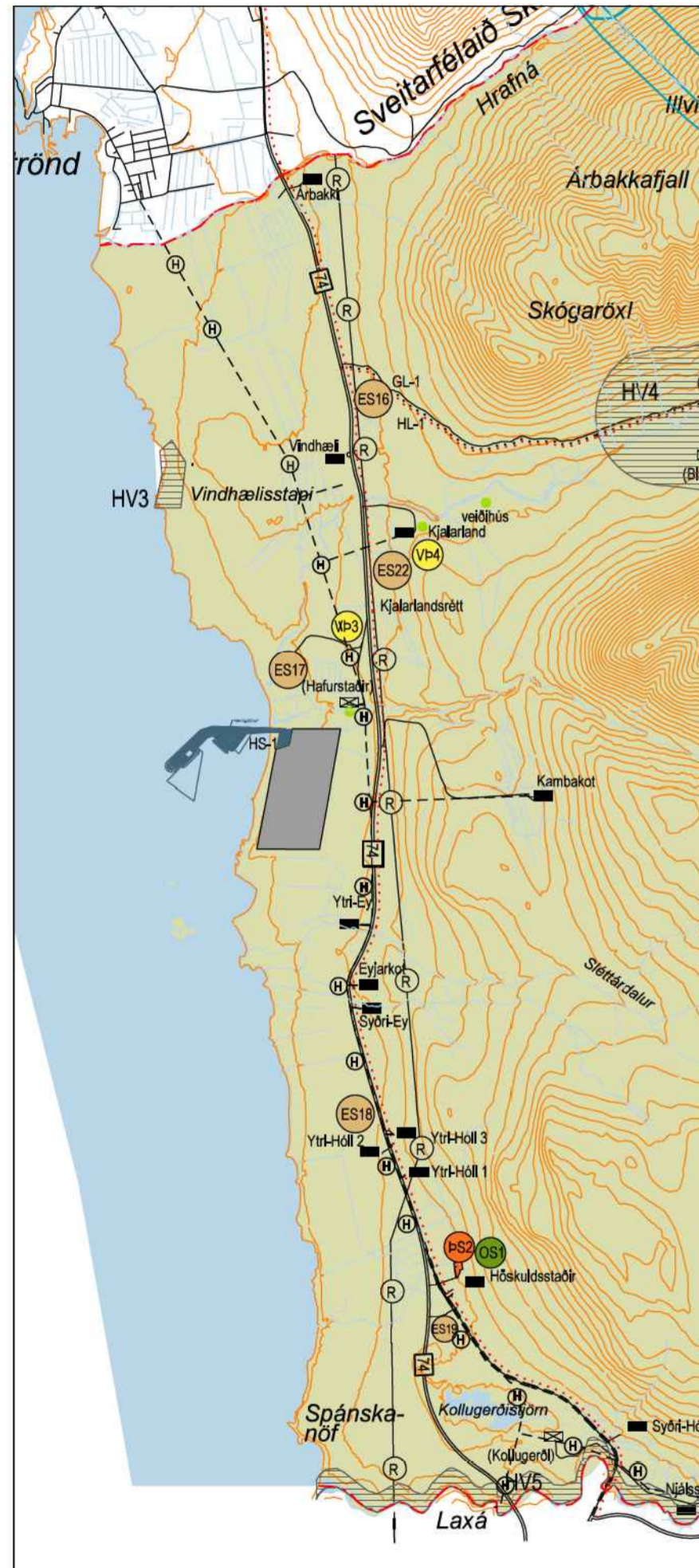
Staðfest aðalskipulag, hinn 5. sept. 2011